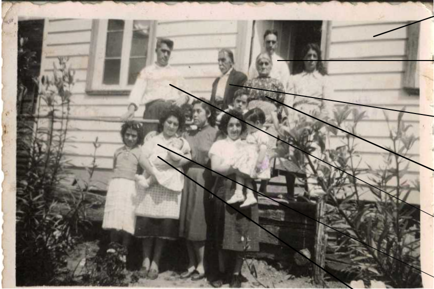
La casa en ribera sur en Aysén que ya no existe